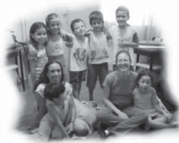
Alguns alunos da turma do Pré do Alecrim Dourado

Professora e Coordenadora Pedagógica do Alecrim Dourado