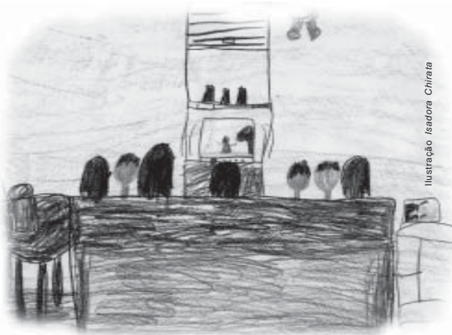
Ilustração Isadora Chirata

A televisão representa o mais extraordinário meio de comunicação de um século marcado exatamente pela excelência técnica e importância crescente da imprensa em todas as suas modalidades. A força da televisão reside menos em suas características de