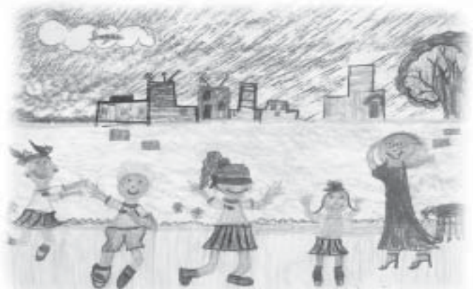
Trabalho feito pela aluna Rebecca com base na visita à Bienal.